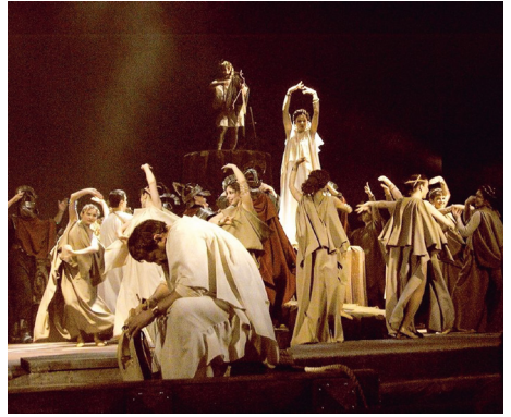
8. Драма «Оргія» на сцені Львівського театру ім. М. Заньковецької. 2004 р.