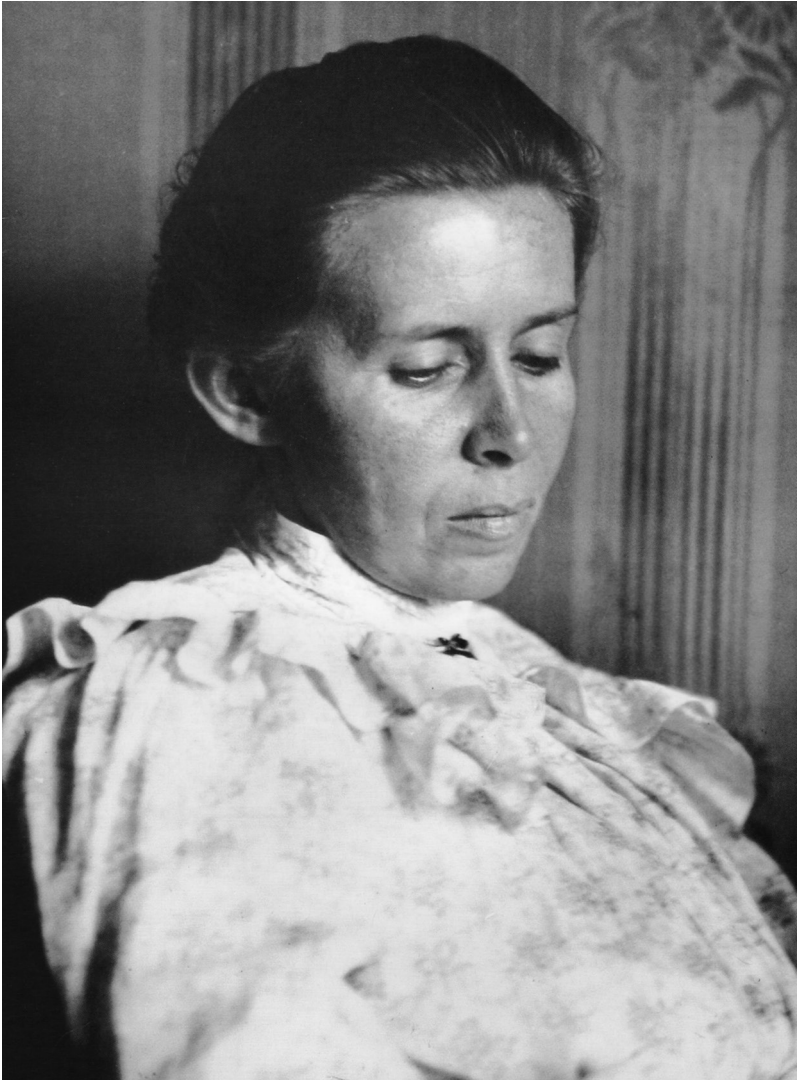
6. Одна з останніх світлин Лесі Українки. Київ, 6 травня 1913 р.