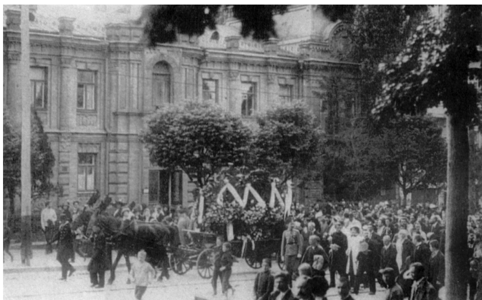
7. Похорон Лариси Косач-Квітки (Лесі Українки). Київ, 1913 р.