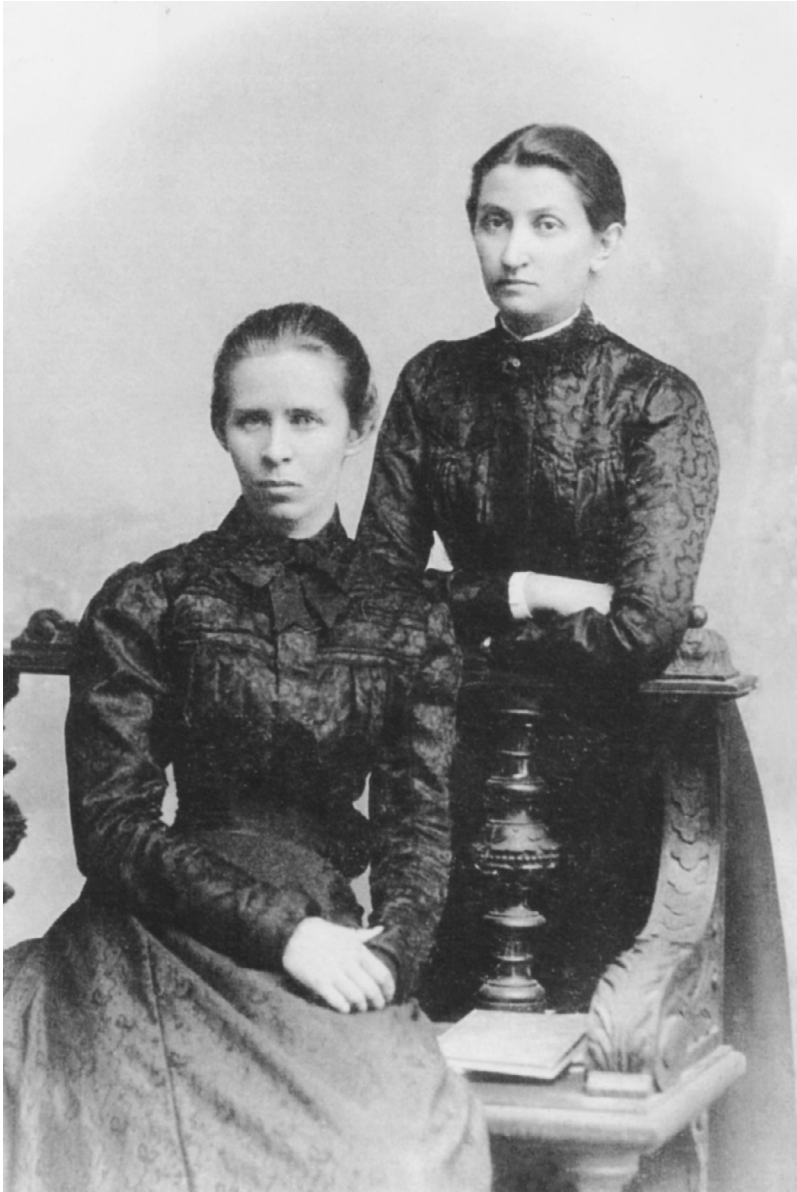
2. Лариса Косач та Ольга Кобилянська. Чернівці, 1901 р.