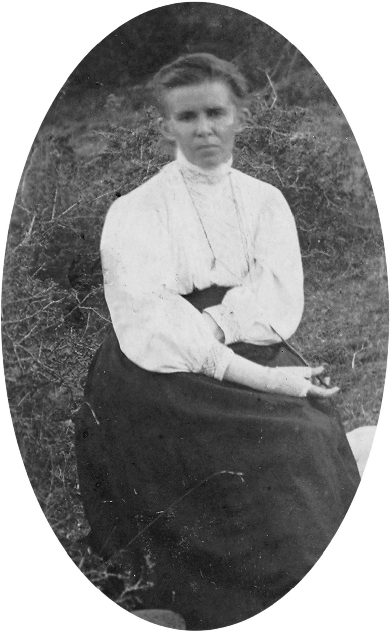
1. Лариса Косач-Квітка. Єгипет, 1912 р.