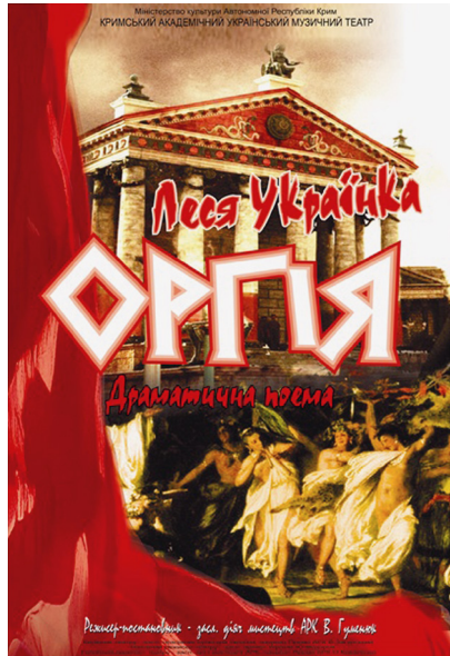
9. Драма «Оргія» на сцені Кримського академічного музичного театру. Режисер В. Гуменюк. Сімферополь, 26 вересня 2012 р.