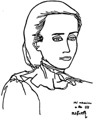
8. Портрет Лесі Українки французького художника М. де Сервіля. 1971 р.