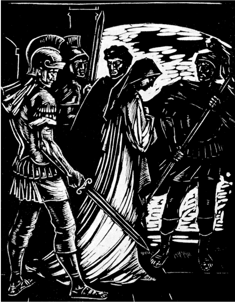
7. Ілюстрація до драми Лесі Українки «Руфін і Прісцилла». М. Попович. Гравюра. 1962 р.