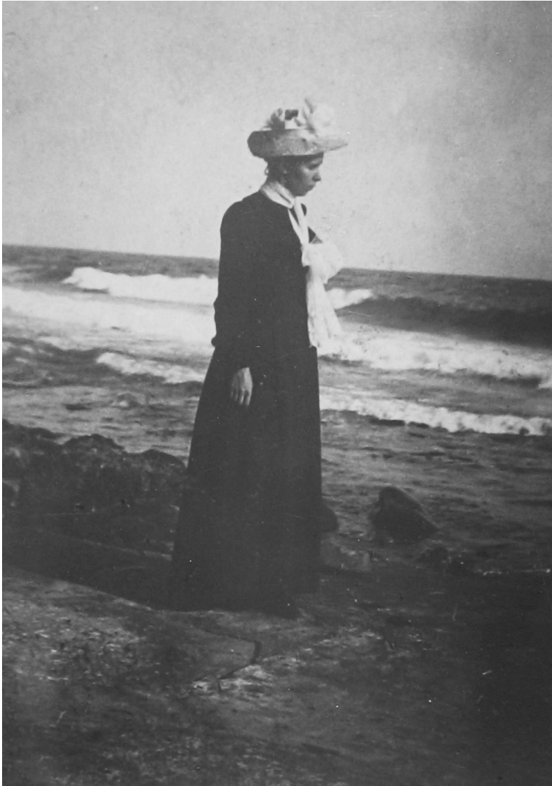
6. Леся Українка в Італії, біля Сан-Ремо. Травень 1902 р.