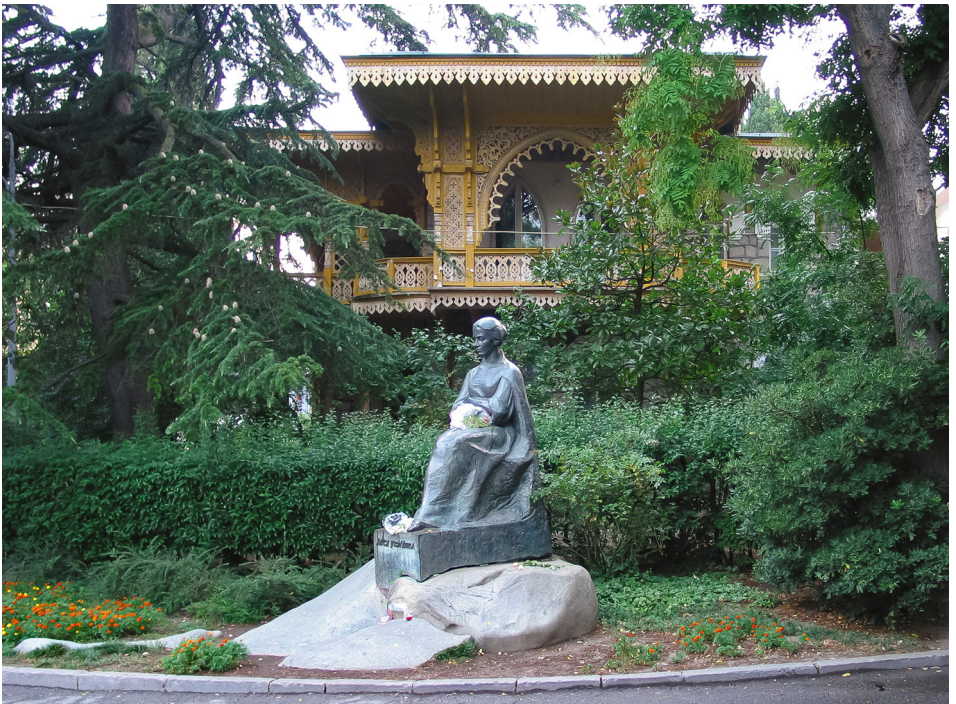
9. Пам'ятник Лесі Українці в Ялті, Крим. Скульптор Г. Кальченко. 1971 р.