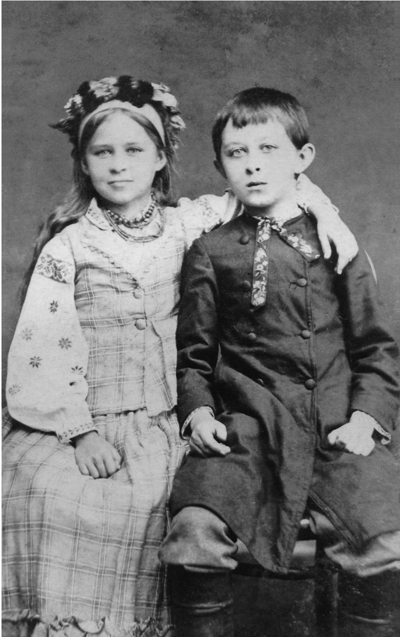
1. Лариса та Михайло Косачі. 1881 р.