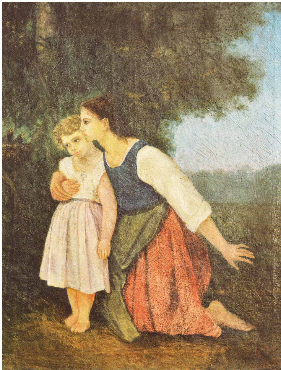
9. Лариса Косач. «Мати з дитиною біля пташиного гнізда». Олія на полотні, 1893 р.