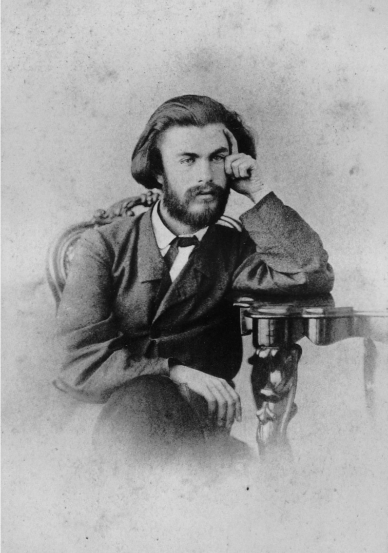
4. Михайло Петрович Драгоманов. Київ, початок 1870-х рр.