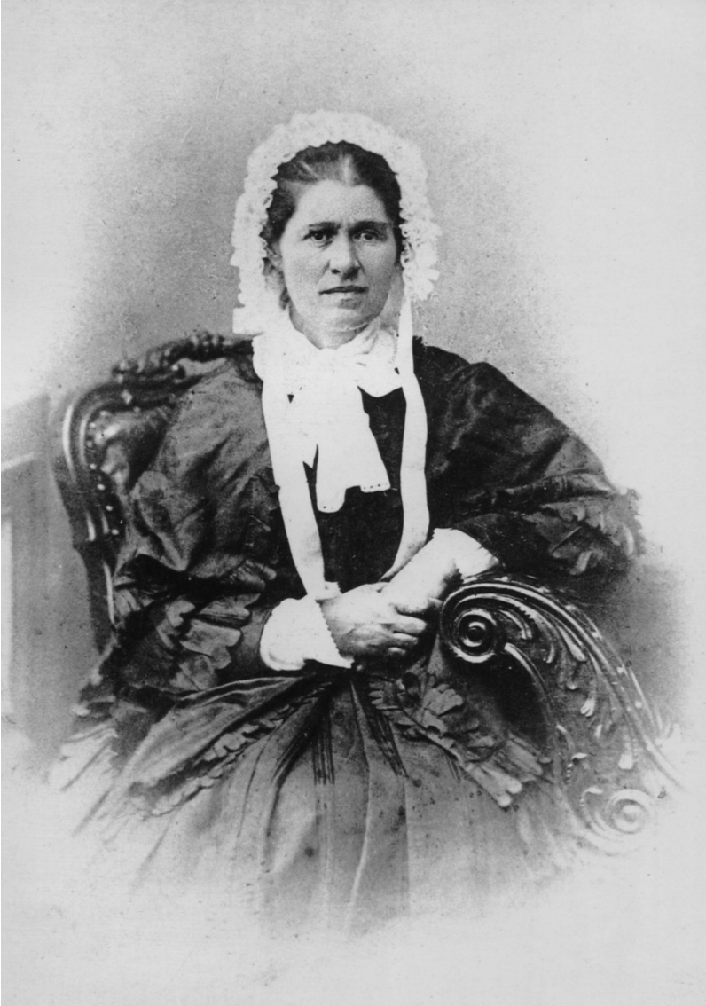
2. Єлизавета Іванівна Драгоманова. Київ, кінець 1870-х рр.